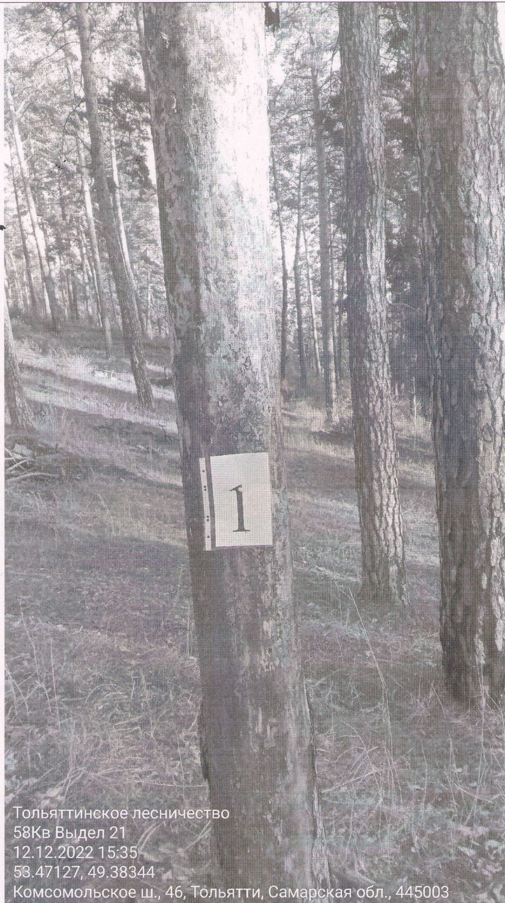
Тольяттинское лесничество 58Кв Выдел 21 12.12.2022 15:35 53.47127, 49.38344 Комсомольское ш., 46, Тольятти, Самарская обл., 445003